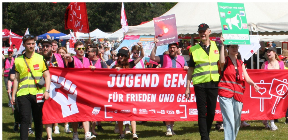
Jugendblock der Gewerkschaften des DGB - Mayari Son aus Cuba