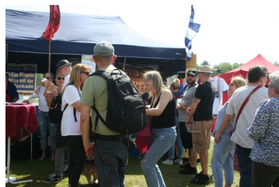
Cocktail-Bar Hemingway - Cuba Treff