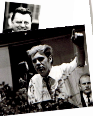
anz zeigte ich Kiesingers Vergangenheit annte Staatsschutz entfernte mich von der Bühne.