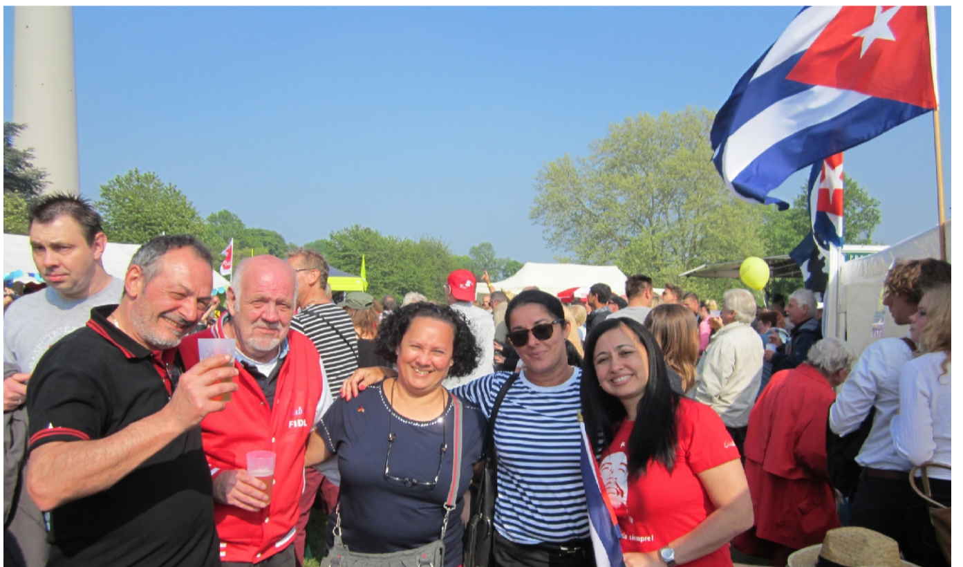
Delegation der Sozialistischen Republik Cuba zu Gast am INFO-TREF der Cuba-Hilfe Dortmund

Der Tag der Arbeit 2023 steht unter dem Motto UNGEBROCHEN SOLIDARISCH . Für ein solidarisches Miteinander in internationaler Solidarität