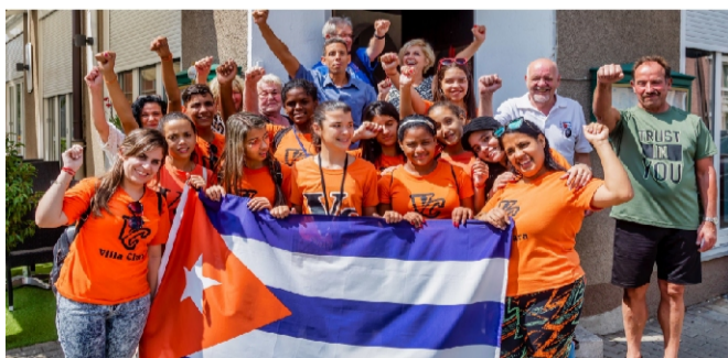
Colmenita in Dortmund

Inzwischen besuchen wir uns einander und so konnten wir eine Gruppe auch in Dortmund begrüßen.