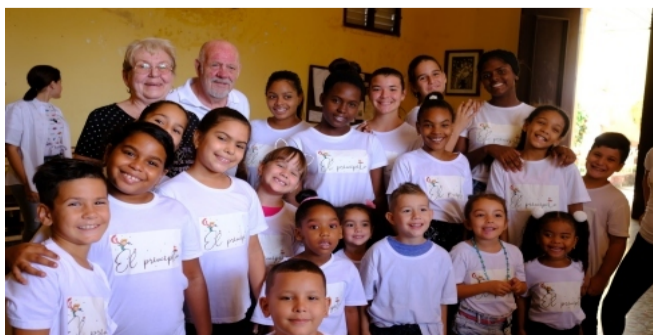
Wir besuchen La Colmenita in Santa Clara