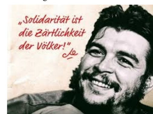
Grafik zur Fiesta Moncada

Unsere Solidarität in Form einer finanziellen Zuwendung überbringen wir in diesen Tagen der Colmenita zur Ausgestaltung ihrer Freizeitaktivitäten. Gerade in diesen Corona-Zeiten wissen wir um die Notwendigkeit einer ausgewogenen Betreuung. Mit unserer Aktion "Solidarität nicht nur ein Wort" helfen wir wo es jetzt notwendig ist.