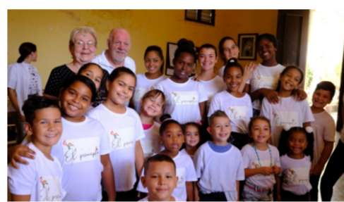
Unsere Delegation zu Gast in Santa Clara

Unsere Solidarität in Form einer finanziellen Zuwendung überbringen wir in diesen Tagen der Colmenita zur Ausgestaltung ihrer Freizeitaktivitäten. Gerade in diesen Corona-Zeiten wissen wir um die Notwendigkeit einer ausgewogenen Betreuung. Mit unserer Aktion "Solidarität nicht nur ein Wort" helfen wir wo es jetzt notwendig ist.