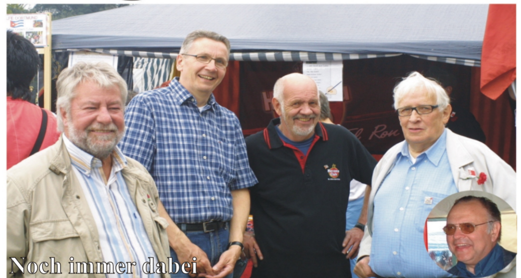
Noch immer dabei