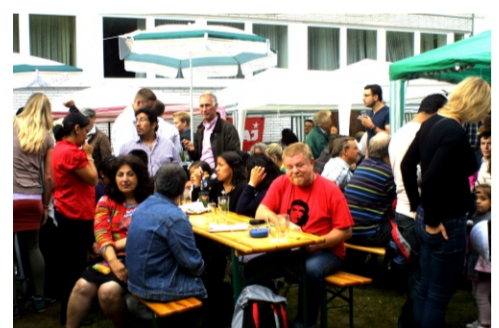
Fiesta Moncada Bonn

Juli/August - Fiesta Moncada Wenn alles klappt, feiern wir unter unserer aktiven Mitwirkung und vielen im Netzwerk vertretenen Soli-Organisationen in der Außenstelle der cubanischen Botschaft in Bonn die Fiesta Moncada.