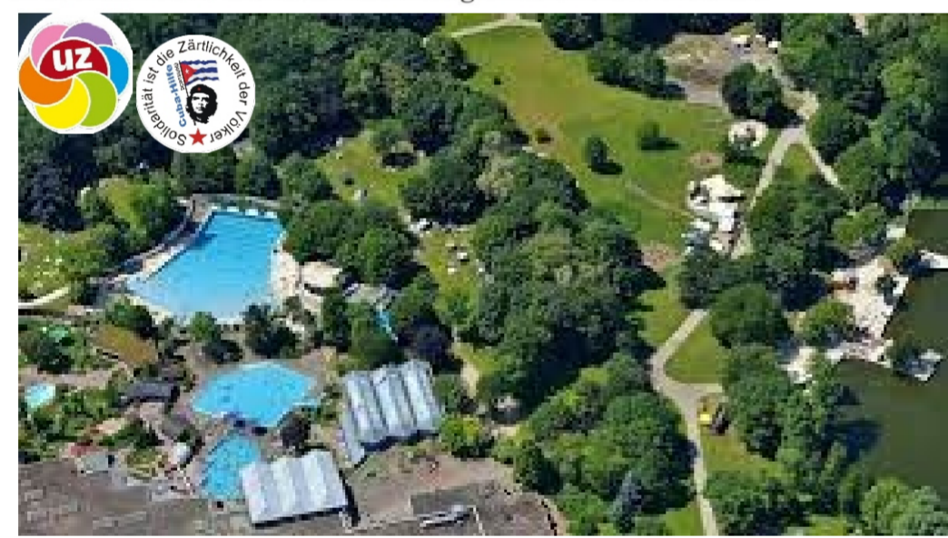
Foto: Revierpark Wischlingen Der Revierpark Wischlingen ist eine Grün- und Erholungsanlage und erstreckt sich über eine Fläche von 39 Hektar ( ca. 40 Fußballfelder ).