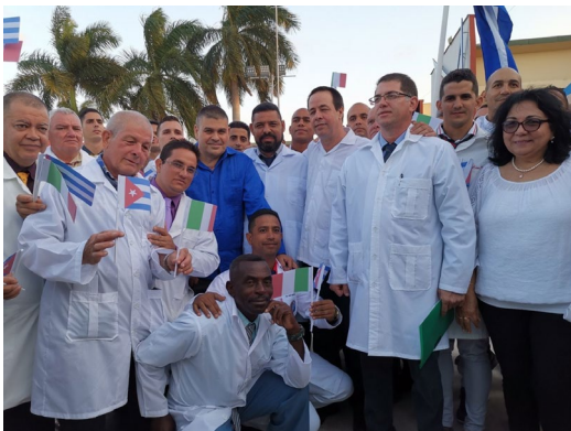
Kubanische Ärzte-Mission in Italien zur Bekämpfung von Corona.

Gebeutelt von jahrhundertelanger Sklaverei, kolonialistischer Ausbeutung und imperialistischer Diktatur, gehört die kleine Karibikinsel mit ihren elf Millionen Einwohnerinnen und Einwohnern zu der Mehrheit der armen Länder auf dem Globus. Während weltweit vier Milliarden Menschen, mehr als jede/r zweite, über keinerlei sozialen Schutz verfügen, auch nicht während der Pandemie, hat die kubanische Revolution 1959 in kürzester Zeit den Analphabetismus besiegt, ein hochentwickeltes, für alle kostenfrei zugängliches Gesundheits- und Bildungssystem errichtet, die Obdachlosigkeit nahezu überwunden, Bedingungen für eine lebendige, vielfältige und beeindruckende Kultur geschaffen. Kuba, das ist Sozialismus mit Musik.