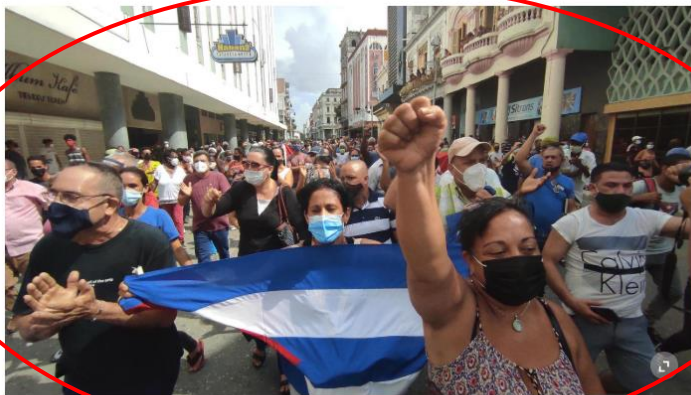
Manifestation à Cuba le 11 juillet 2021.