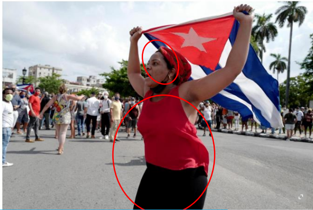
De nombreuses manifestations anti-gouvernement ont eu lieu le 11 juillet à Cuba.

Incluso, Naciones Unidas difundió en Twitter como imagen de las protestas a unos manifestantes que se movilizaban en sentido contrario. Uno de ellos lo denunció en las redes y la reacción de Twitter al entrar en su perfil fue insertar este mensaje: "Precaución: Esta cuenta está temporalmente restringida. Estás viendo esta advertencia porque se detectó actividad inusual en esta cuenta". La ONU terminó retirando el tuit.