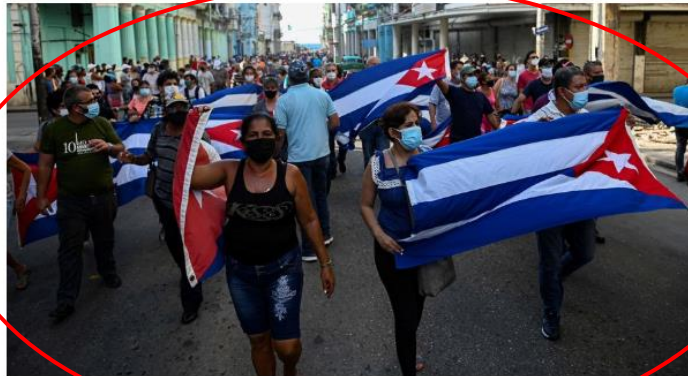
La Havane, le 12 juillet 2021.

Accablés notamment par les pénuries d'aliments et de médicaments, des milliers de Cubains sont sortis dans les rues dimanche. L'écrivaine Zoé Valdés, Cubaine exilée en France, analyse les raisons de cette colère